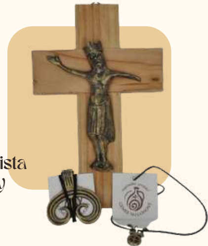
Bronzový korpus Krista bronzové prívesky

Sériu bronzových replík originálnych predmetov vystavených v našej stálej expozícii. Prvým z nich je replika bronzového pozláteného korpusu Krista, ktorý bol nájdený v jaskynnom systéme Domica-Baradla. Ďalšie dva sú prívesky z doby bronzovej a to srdcovitý závesok a závesok typu Včelince. Pochádzajú z obdobia začiatku strednej doby bronzovej (1500 – 1450 p.n.l.).