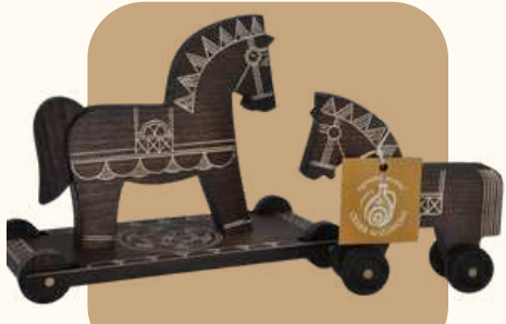
Kyjatické drevené koníky