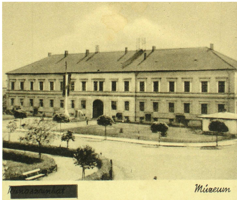
Budova múzea, okolo roku 1940

Cieľom vedecko-výskumnej úlohy bolo spracovanie histórie Gemersko-malohontského múzea v období druhej svetovej vojny. Bolo to ťažké obdobie pre inštitúciu, pretože mesto do roku 1938 patrilo do Československej republiky, ale počas vojny bolo súčasťou Maďarského štátu. Počas vojny sa veľký počet dokumentov stratil, preto k dispozícii máme len málo údajov. Informácie boli získané predovšetkým z dokumentov z archívu múzea. Výsledkom výskumu je príspevok v Zborníku Gemersko-malohontského múzea GEMER-MALOHONT 12/2016.