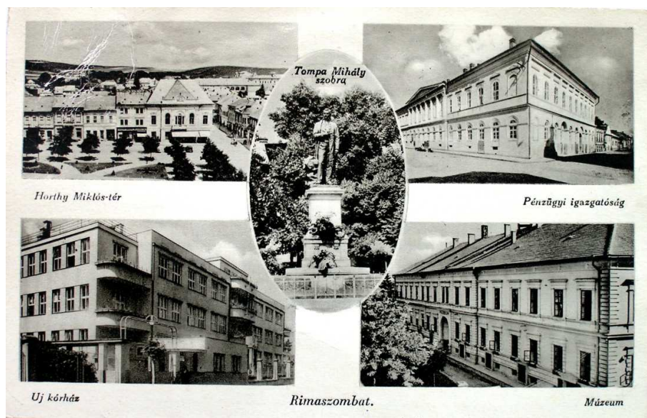
Pohľadnica Rimavskej Soboty, okolo roku 1940